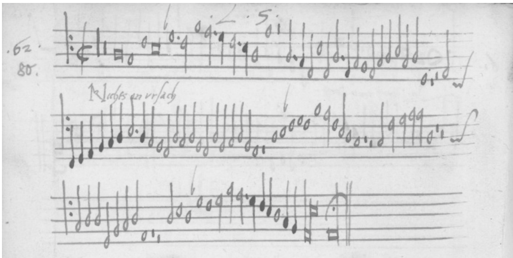
Abbildung 1: CH-Bu, Ms. F.X.4 (Bassus), fol. 45v

Die Einträge in den vier Basler Stimmbüchern sind übereinstimmend mit der Textmarke „Nichts on vrsach“ versehen (siehe Abbildung 1), ein Textanfang, der bislang kein weiteres Mal nachweisbar ist.