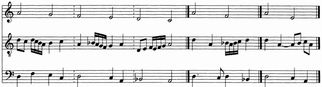
Beispiel 4: Hans Buchner, Tabula Discantus in descensu / Discantus distat a tenore in Sexta (Auszug) 92

Es geht Buchner nicht um die Einübung von extensiven, virtuosen Verzierungen in einer Stimme, wie dies in späteren Instrumentalschulen mit vergleichbaren Diminutionstabellen der Fall ist, 91 sondern ganz offensichtlich um die Übung einer Kompositionsweise, die ein Gerüst aus Intervallverbänden in einem zweiten gedanklichen Schritt so weit auskleidet, dass es hinter einer neuen Struktur rhythmisch unabhängiger Stimmen verschwindet. Daher werden die Klangsäulen in seinen Tabellen nicht nur durch rasche Spielfiguren oder durch ruhigere Wechselnoten und Durchgänge ausgekleidet, sondern auch durch konsonante Zwischenklänge, die für denselben Ton des Cantus firmus einen weiteren Intervallverband verwenden.